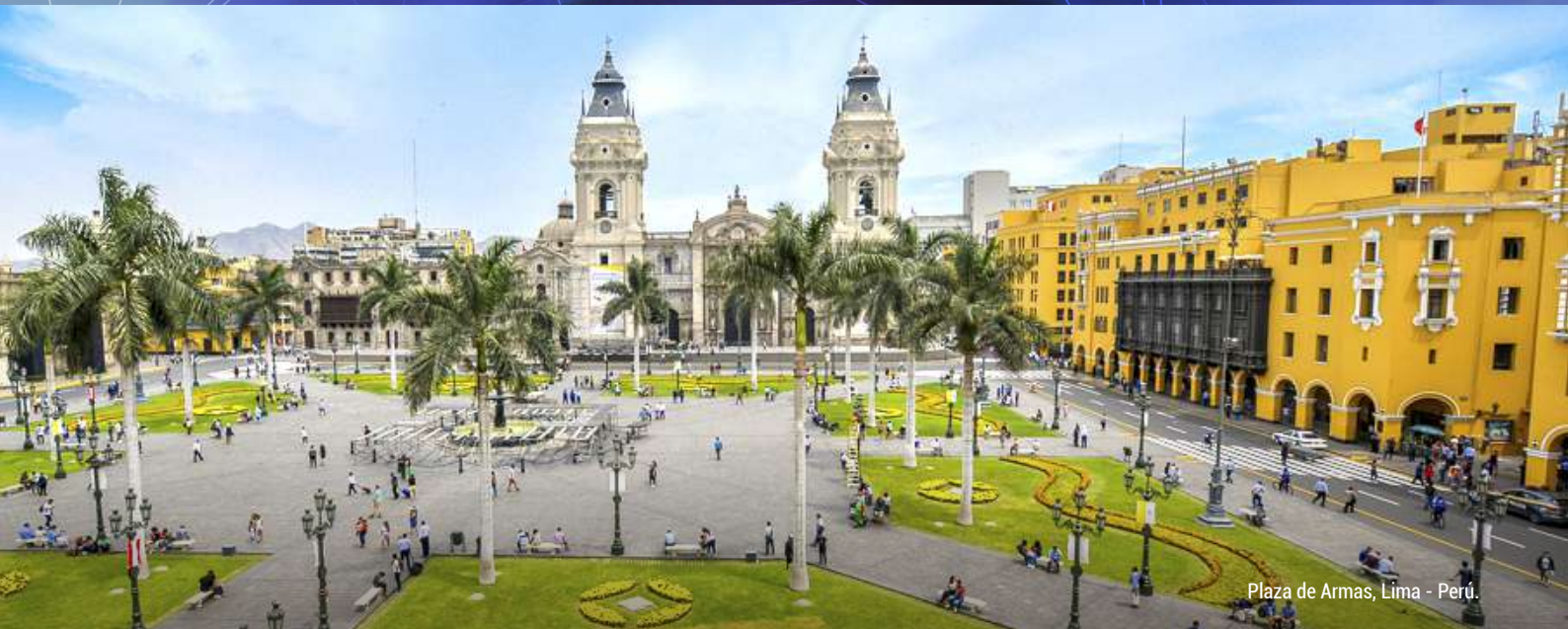
Plaza de Armas, Lima - Perú.